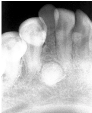
Rx. retroalveolar zona 22

Efectivamente en zona pieza 22 se aprecia persistencia pieza M con rizálisis. Intraóseo; se observa imagen sospechosa de Odontoma.