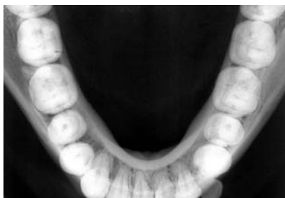
Rx. oclusal inferior estricta

Se presenta proyección Panorámica que cambia sustancialmente la situación clínica de la paciente.