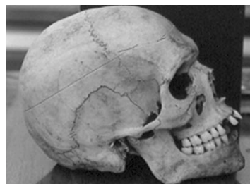
Figuras 3 y 4

Se utilizaron con éxito radiografías antiguas (1976), para comparar con recientes (figs. 3 y 4).